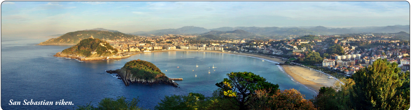
San Sebastian viken.