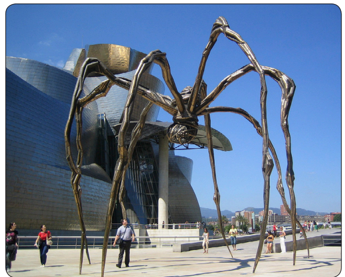
Utanför Guggenheimmuseet i Bilbao står jättespindeln "Mamma".

På baskiska heter staden Donostia. Det är Spanien men ändå inte. Baskien är som ett land i landet, en autonom provins som många basker gärna skulle se helt självständig från Spanien. Av landets 46 miljoner invånare är omkring